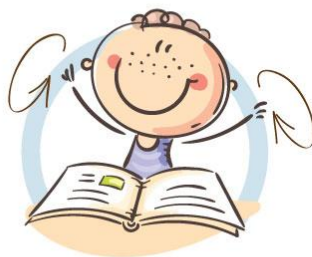
2. ФИЗКУЛЬТМИНУТКА ДЛЯ СНЯТИЯ УТОМЛЕНИЯ С ПЛЕЧЕВОГО ПОЯСА И РУК