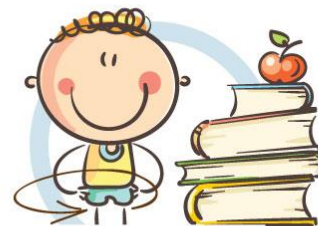
3. ФИЗКУЛЬТМИНУТКА ДЛЯ СНЯТИЯ УТОМЛЕНИЯ КОРПУСА ТЕЛА