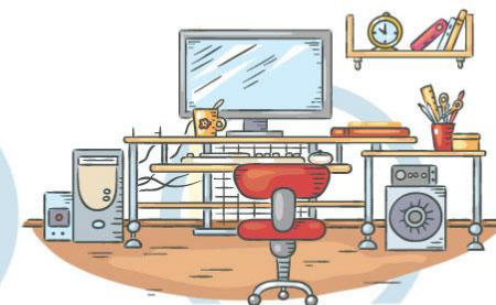
5. СООТВЕТСТВИЕ МЕБЕЛИ