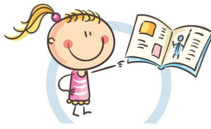
3. РАССТОЯНИЕ ДО КНИГ