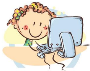
2. ПОЛОЖЕНИЕ МОНИТОРА