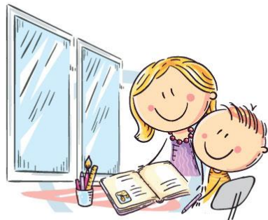
1. ЕСТЕСТВЕННОЕ ОСВЕЩЕНИЕ

ЕДИНЫЙ КОНСУЛЬТАЦИОННЫЙ ЦЕНТР РОСПОТРЕБНАДЗОРА 8-800-555-49-43