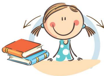
1. ФИЗКУЛЬТМИНУТКА ДЛЯ УЛУЧШЕНИЯ МОЗГОВОГО КРОВООБРАЩЕНИЯ