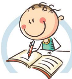
4. СИДИТЕ ПРАВИЛЬНО